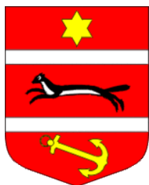
Virovitičko - podravská županija