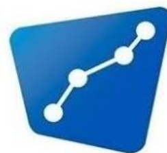
Poduzetnički inkubator Virovitičko - podravské županije d.o.o.